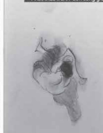
Phác thảo tranh 'Con công giò'