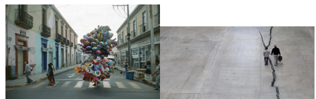
Trái: Francis Alys 'Ambulantes' (chi tiết của loạt tác phẩm ảnh) 1992-2006; Phải: Doris Salcedo 'Shibboleth' (chi tiết sắp đặt ở Tate Modern, London, Anh) 2007-2008

Một khía cạnh trong thực hành nhiếp ảnh của bạn mà tôi đặc biệt chú ý đó là những sắp đặt "được tìm thấy". Ý tôi là các tình huống mà bạn đã "tìm thấy" - những bậc thang kỳ lạ với chiếc áo mưa lơ lửng treo; tấm biển quảng cáo với lớp lót bạc trống trơn, ủ rũ trước gió; hay cây kiểng nhựa màu xanh lá cắm xuống lòng sông khô cạn. Tất cả những "cảnh" này, tuy đều được ngẫu nhiên "tìm thấy", nhưng lại gợi cho tôi về các tác phẩm của các nghệ sĩ nổi tiếng như Francis Alys và Doris Salcedo. Nghệ thuật của họ, theo một cách tương tự, cũng tận dụng các khoảnh khắc tình cờ, hay một "sân khấu" được sắp xếp cẩn thận. Bạn có thể chia sẻ về các nghệ sĩ đã truyền cảm hứng cho bạn, tạo ảnh hưởng tới thực hành của bạn?